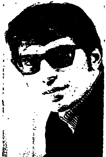
الشرطة من تحقيقاتها لم سيطلب منه الرد على الاتهامات الموجهة ضده بالوصول على الرضوة .

لدى انصاره لاقلاعهم بكتف من كبل لهم للشرطة بناء على طلب السيد نافون من جهة اخرى علم ان البروفيسور اسحق زير المستشار القانوني للجمهورية لمن يجتنب بالسيد ابو حصيرة قبل ان تنهي